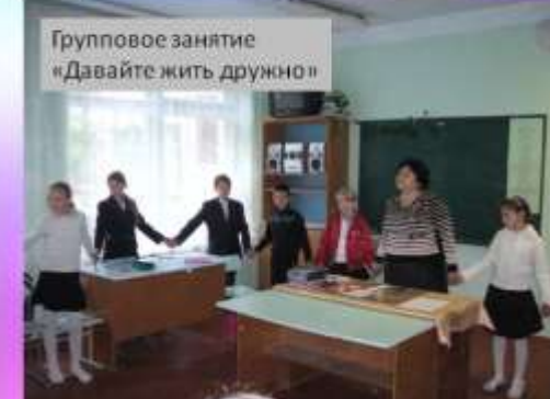
Групповое занятие «Давайте жить дружно»