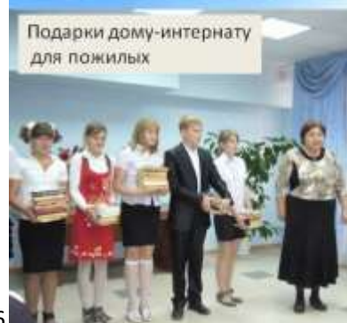
Подарки дому-интернату для пожилых