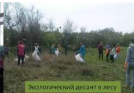
Экологический десант в лесу